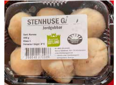
En rolig vinst på Röda Korsets lotteri!